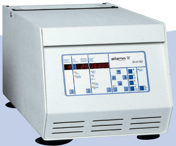
Tischkühlzentrifuge Refrigerated Centrifuge